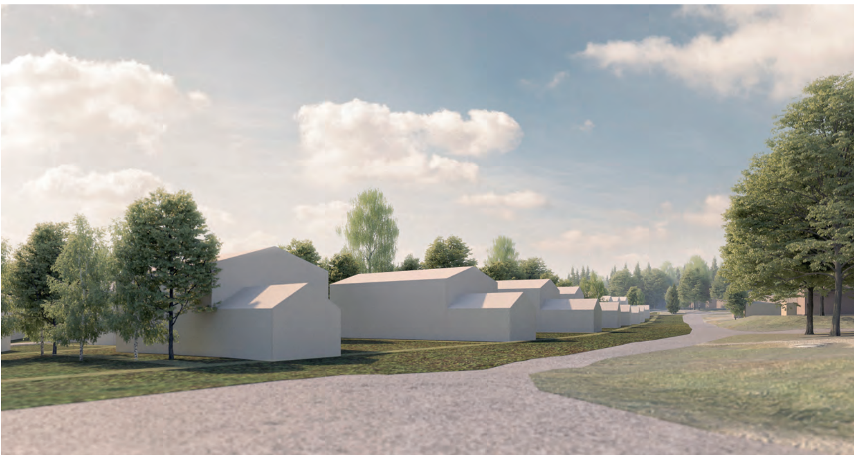
Katunäkymä Kiuruntieltä Peurantielle päin.