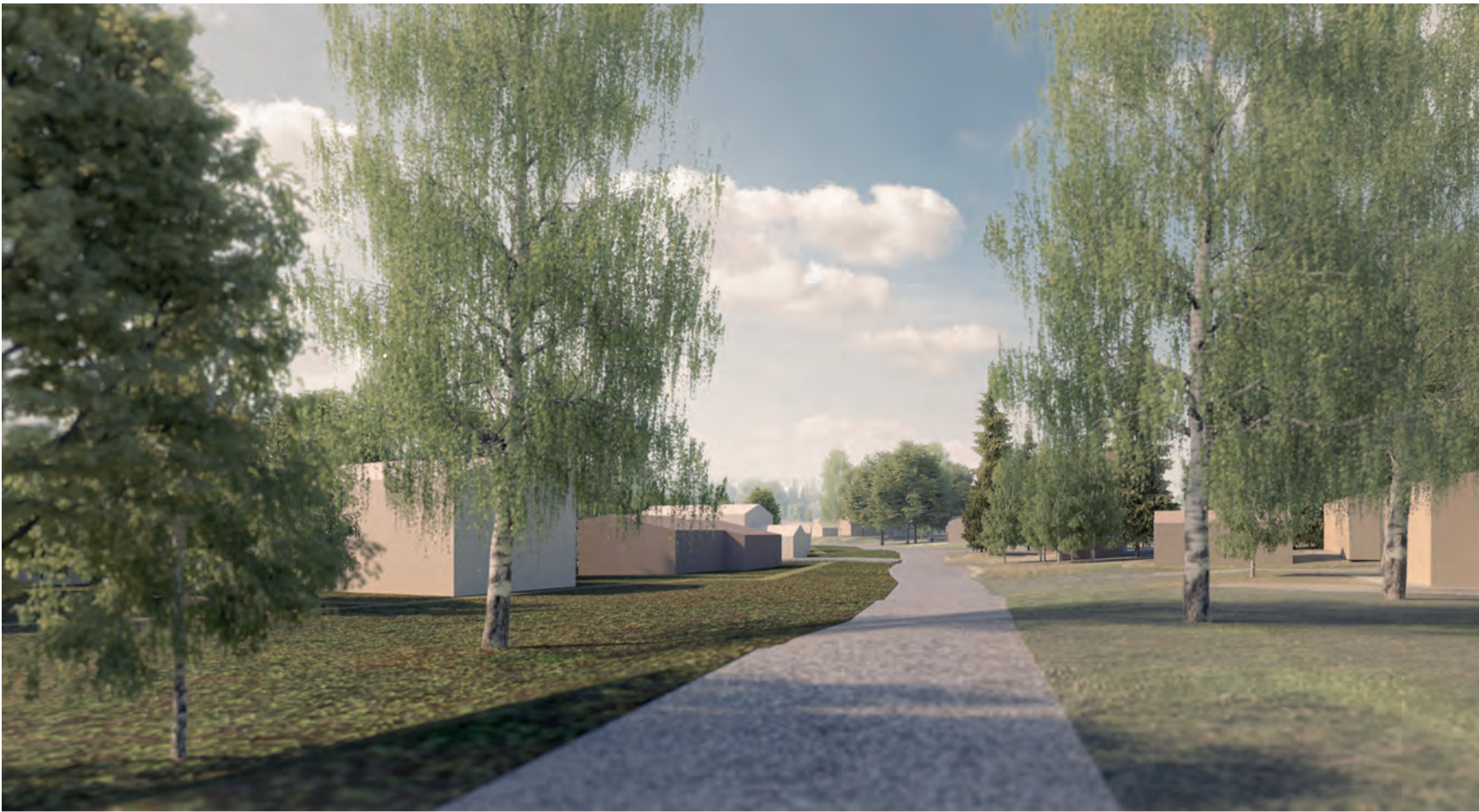
Katunäkymä Peurantieltä pohjoisesta etelään.

Peurantien katualue tulee leventymään ja muuttumaan kaava-alueen ja kevyen liikenteen väylän rakentumisen myötä