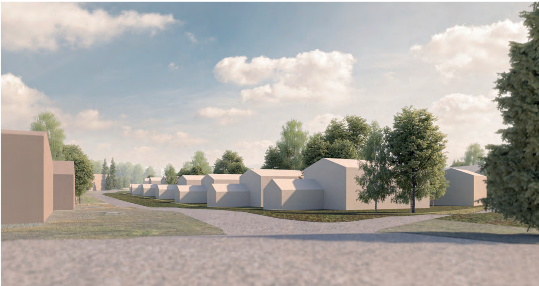
Katunäkymä Kurjentieltä Peurantielle päin.

Peurantien katualue tulee leventymään ja muuttumaan kaava-alueen ja kevyen liikenteen väylän rakentumisen myötä